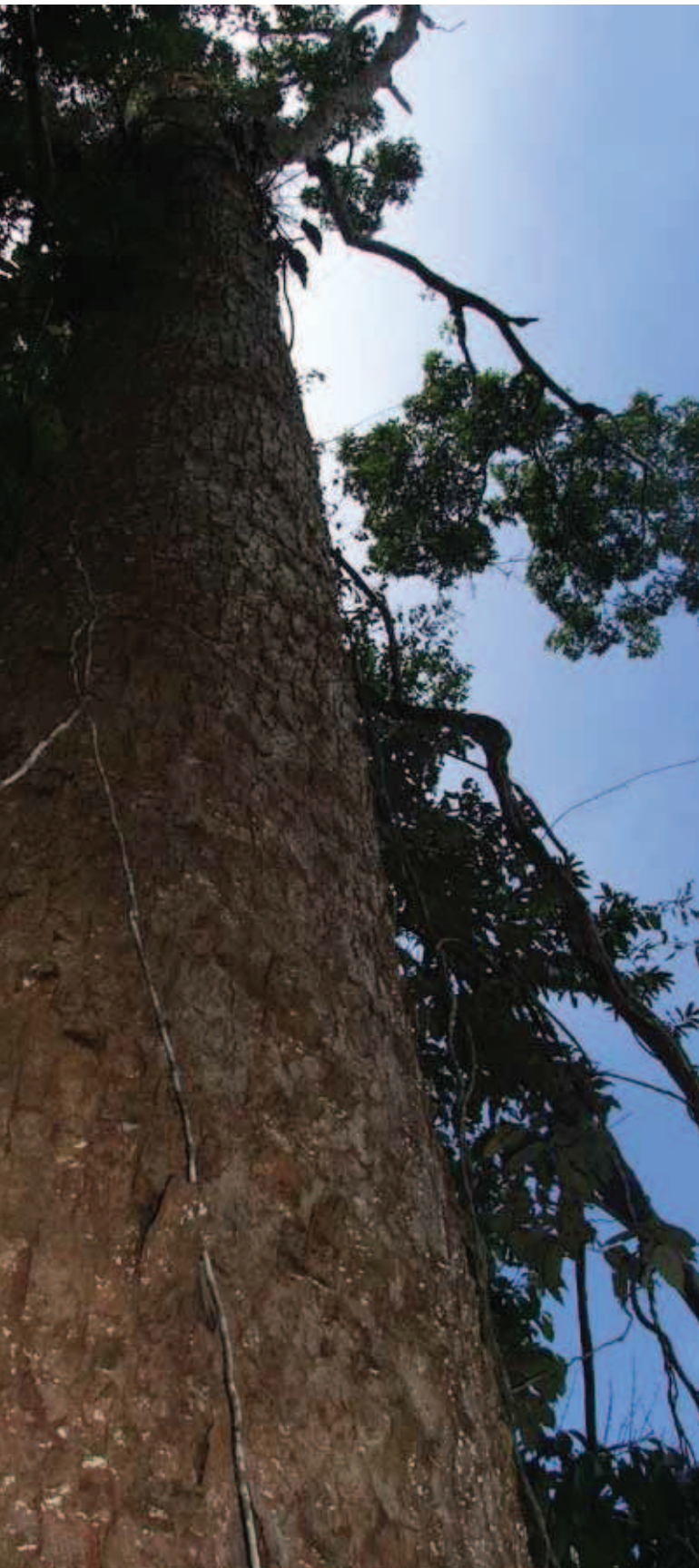
laninuca. Buchinana tetraphylla , Juan Carlos Arias